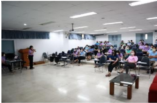
คณะสัตวแพทยศาสตร์ มหาวิทยาลัยเชียงใหม่ จัดประชุมปุ่เสื้อ ครั้งที่ 1/2565 สำหรับบุคลากรสายสนับสนุน เพื่อรับฟังการชี้แจงเกณฑ์การประเมินผลปฏิบัติงานสายปฏิบัติในสังกัดหน่วยงานสำนักงานคณะฯ และแจ้งข้อมูลข่าวสารที่สำคัญจากหน่วยงานต่างๆ ภายในคณะฯ ณ ห้องประชุม B402 เมื่อวันที่ 6 กรกฎาคม 2565