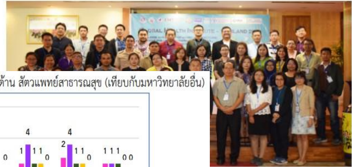
7.1ก15 จำนวนการจัดการประชุมอบรมวิชาการนานาชาติด้าน สัตวแพทย์สาธารณสุข (เทียบกับมหาวิทยาลัยอื่น)